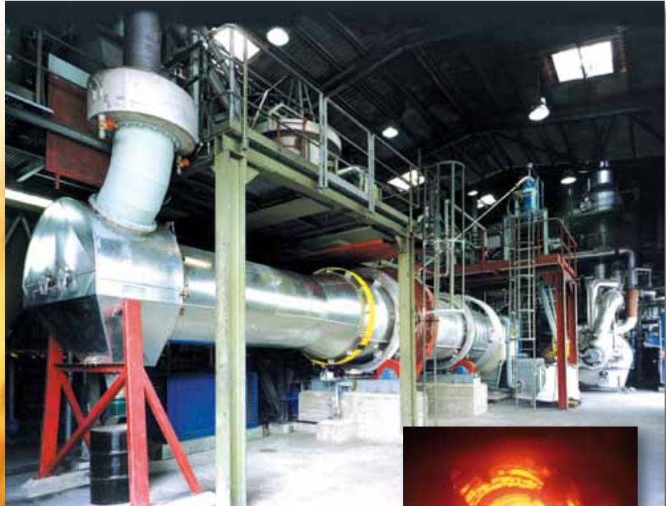
Reaktivierungsanlage in Frankfurt am Main Reactivation Plant Frankfurt am Main

Durch Nutzung vorhandener Ressourcen wie z. B. im Werk Landeck in Österreich oder bei zertifizierten Fachfirmen besteht die Möglichkeit der Verwertung gebrauchter kohlenstoffhaltiger Materialien. Nicht mehr regenerierbare bzw. reaktivierbare Aktivkohlen ersetzen bei der Kalziumkarbid Produktion wertvollen Primärbrennstoff. Damit wird im Sinne des Umweltschutzes ein Kreislauf geschlossen.