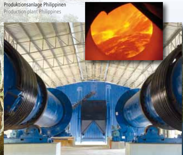
Produktionsanlage Philippinen Production plant Philippines

At Pischelsdorf site (A), we produce Activated Carbon for special applications in own plants.