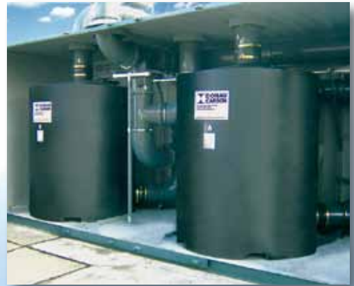
Teil- oder Komplettanlagen Individual Units or complete systems

All adsorber types offered by us are available either for sale or for rental. Our standard adsorber vessels can normally be delivered within a few days. Upon request, we also supply custom-designed vessels to your specification.