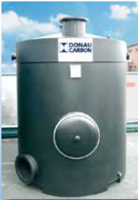
Servicefilter zur Gas-, Luft- und Wasserreinigung Gas- and Liquid-phase adsorbers

Sämtliche Adsorber bieten wir wahlweise zum Kauf oder zur Miete an. Unsere Standard Filterbehälter sind in der Regel innerhalb weniger Tage lieferbar, auf Anfrage liefern wir jedoch auch spezielle Behälter nach Kundenspezifikation.