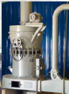
Aufmahlung mit spezieller Mühle Milling Station