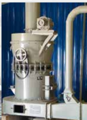
Aufmahlung mit spezieller Mühle Milling Station