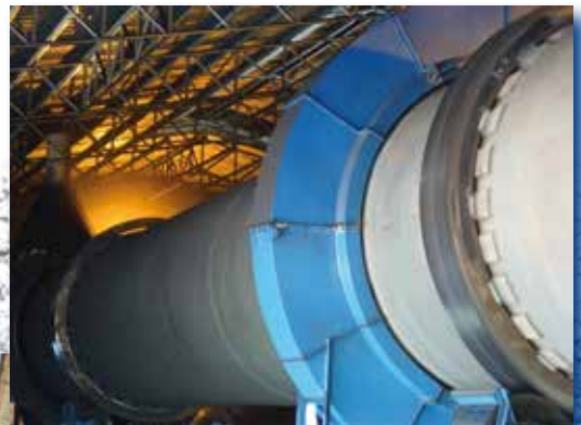
Drehrohrofen Rotary Kiln

For markets with special requirements in the field of water treatment, our products are NSF-certified.